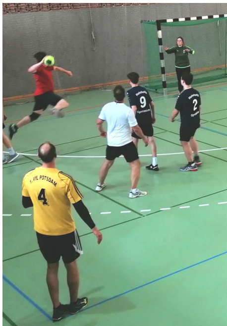
Action – life ...