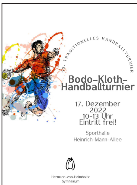
... und auf dem Plakatentwurf von Schülern

Die Schule wird im Dezember mit zwei Schulmannschaften bei den Jungen und einem Lehrerteam am Start sein. Zusätzlich laufen Gespräche mit anderen Gymnasien aus Potsdam, um auch von dort Mannschaften für eine Teilnahme zu aktivieren. Damit wird das Turnier an Attraktivität und Stellenwert innerhalb und außerhalb des Gymnasiums gewinnen.